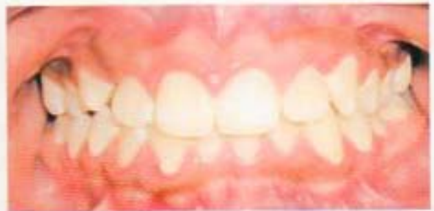
Fig. 5. Intraoral de frentes líneas medias no coincidentes.