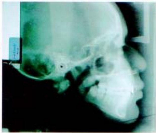
Fig. 9. Radiografía cefálica lateral cráneo.