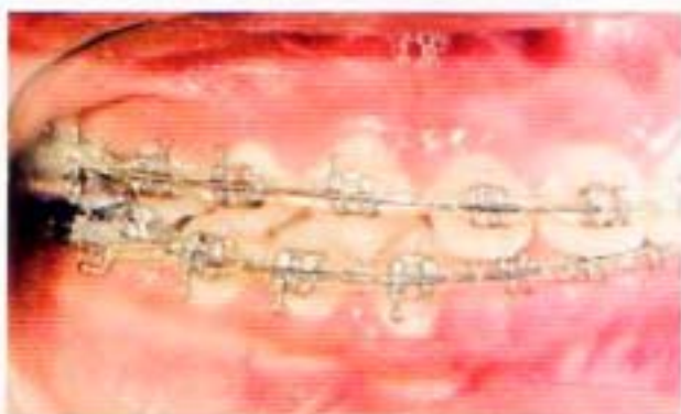
Fig. 16. Intraoral lateral derecha observamos la clase I molar y canina.