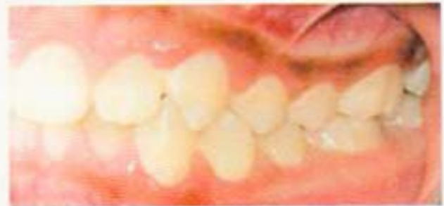
Fig. 6. Intraoral lateral izquierda clase II canina clase I molar.