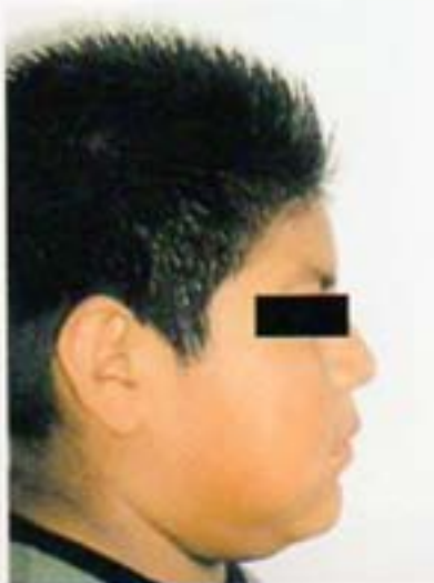
Fig. 3. Perfil.