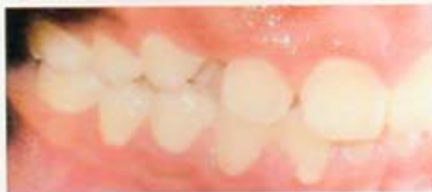
Fig. 4. Intraoral. Inicial derecha clase II molar, clase canina no determinada.