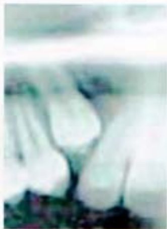
Fig. 10. Radiografía periapical del canino superior derecho reclinado.