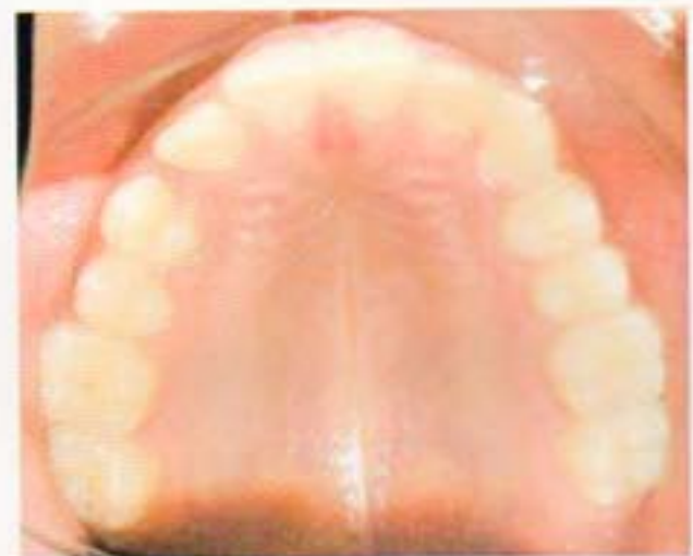
Fig. 7. Fotografía intraoral oclusal superior de canino retenido.