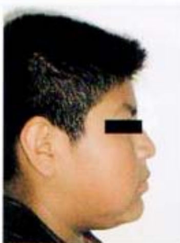
Fig. 15. Progreso de perfil.