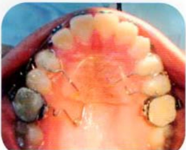
Fig. 12. Pendolom unilateral del lado.