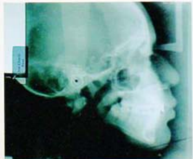
Fig. 8. Intraoral oclusal inferior.